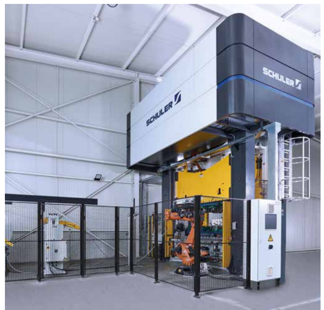
Automatisierte Fertigungszelle zur Herstellung von Automotive-Teilen.

Die Pressen der HPX-Baureihe sind für ein günstiges Preis-Leistungs-Verhältnis konzipiert. Sie decken ein universelles Einsatzspektrum ab und sind erweiterbar für automatisierte Fertigungssysteme. Hohe Qualitätsstandards sorgen für Investitionssicherheit und Wartungsfreundlichkeit. Pressen der Baureihe HPX verbinden maximale Fertigungsflexibilität mit Komfort im Alltagsbetrieb. Und nicht zuletzt steht Schuler für zuverlässige, bewährte Pressen mit hoher Verfügbarkeit, für kurze Lieferzeiten und jederzeit verlässliche Service-Qualität.