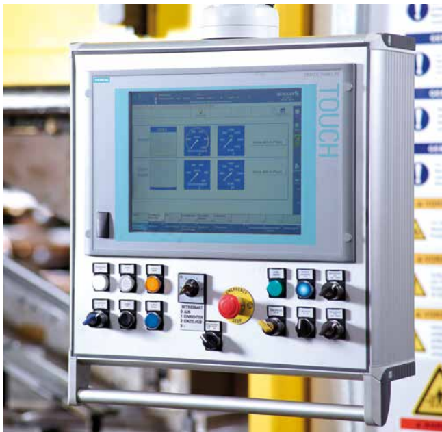
Schüler-Bedienerführung: übersichtlich und selbsterklärend.