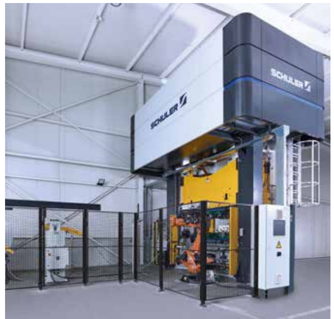
Automatisierte Fertigungszelle zur Herstellung von Automotive-Teilen.

Die Pressen der HPX-Baureihe sind für ein günstiges Preis-Leistungs-Verhältnis konzipiert. Sie decken ein universelles Einsatzspektrum ab und sind erweiterbar für automatisierte Fertigungssysteme. Hohe Qualitätsstandards sorgen für Investitionssicherheit und Wartungsfreundlichkeit. Pressen der Baureihe HPX verbinden maximale Fertigungsflexibilität mit Komfort im Alltagsbetrieb. Und nicht zuletzt steht Schuler für zuverlässige, bewährte Pressen mit hoher Verfügbarkeit, für kurze Lieferzeiten und jederzeit verlässliche Service-Qualität.