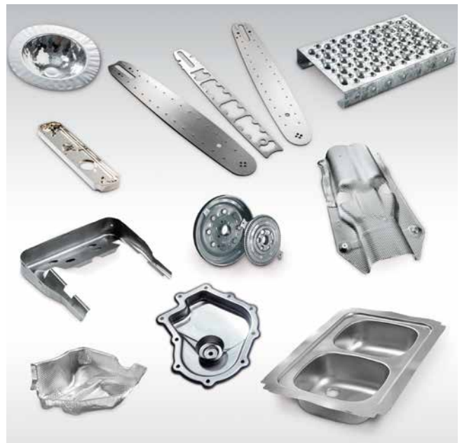
HPX-Pressen für ein breites Bauteilspektrum.

Volle Integration. Die Baureihe HPX ist nahtlos eingebunden in die umfassende Schuler-Welt. Sie bietet nicht nur die bewährte Schuler-Bedienoberfläche, sondern als modularer Baukasten auch vielfältige Erweiterungsmöglichkeiten mit definierten Schnittstellen für Pressenautomation.