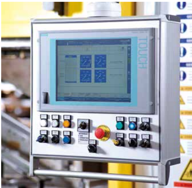
Schüler-Bedienführung: übersichtlich und selbsterklärend.